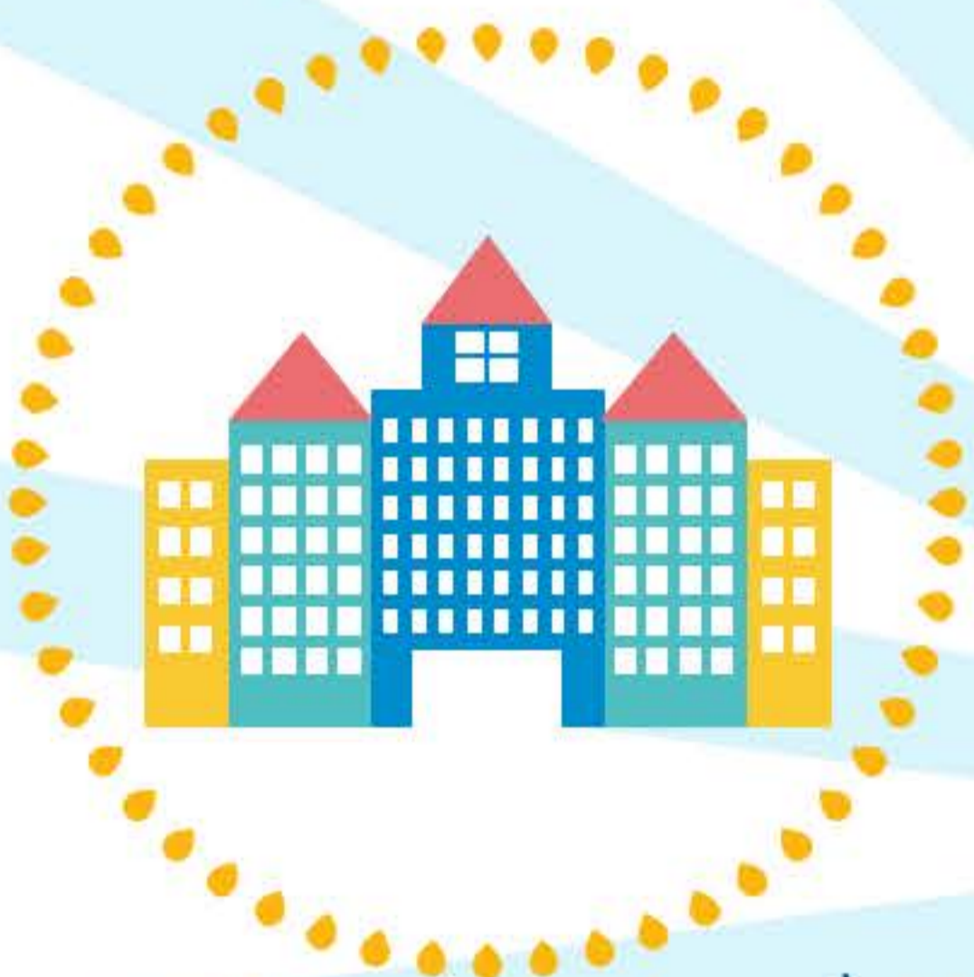
สถานประกอบกิจการประเภทที่ 6-13

➔ สำนักงานที่ปฏิบัติงานสนับสนุนสถานประกอบกิจการตาม (1) ถึง (12)