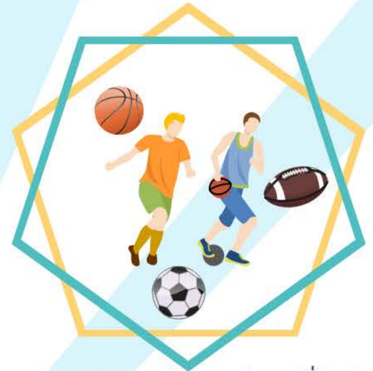
สถานประกอบกิจการประเภทที่ 6-13