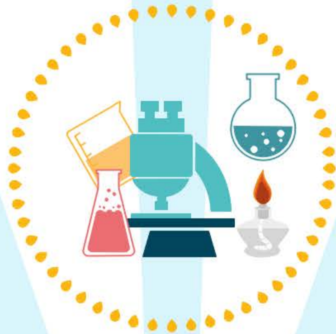
สถานประกอบกิจการประเภทที่ 6-13