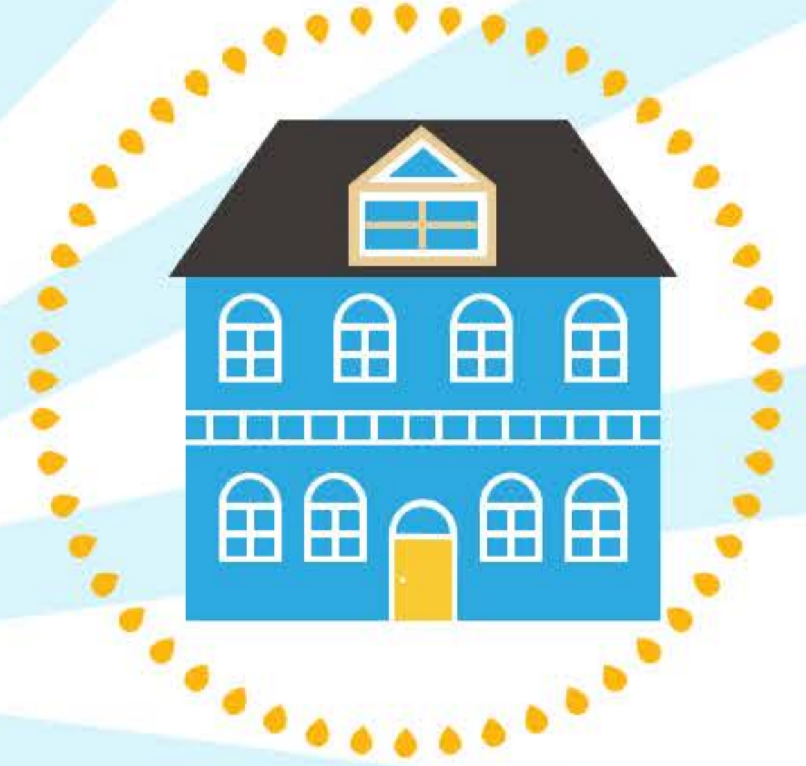
สถานประกอบกิจการประเภทที่ 6-13