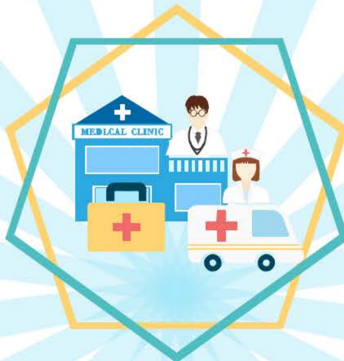
สถานประกอบกิจการประเภทที่ 6-13

➔ สำนักงานที่ปฏิบัติงานสนับสนุนสถานประกอบกิจการตาม (1) ถึง (12)